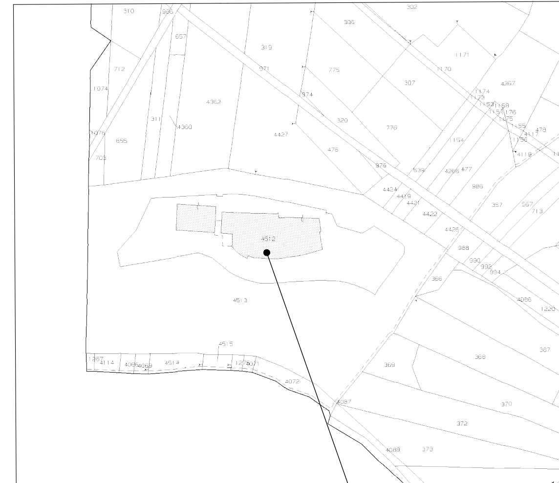
Stralcio Planimetria Catastale foglio n.14 part.4512 scala 1:2000